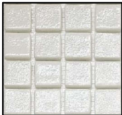
Mozaika basenowa ceramiczna biała: mix mat i szklana – ściana